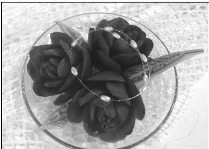
Ukázka práce - květy z červené řepy

Kurz bude probíhat od 9.00 do 12.00 a po pauze na oběd od 13.00 do 16.00 hod. Kurz povedou zkušení lektori z ISS-COP z Valašského Meziříčí. Zájemci o kurz uhradí pouze náklady na použitou zeleninu, a to ve výši 100 Kč. Celá akce bude probíhat v Klubu důchodců, proto prosíme zájemce, vzhledem k omezenému počtu míst, o závazné přihlášení a uhrazení poplatku. Zájemci se mohou hlásit u paní Procházkové na tel. číslo 571 627 826 nebo email: prochazkova@zasova.cz