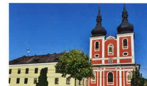
1 Poutní kostel a trinitářský klášter