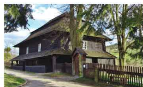
4 Toleranční kostel Velká Lhota