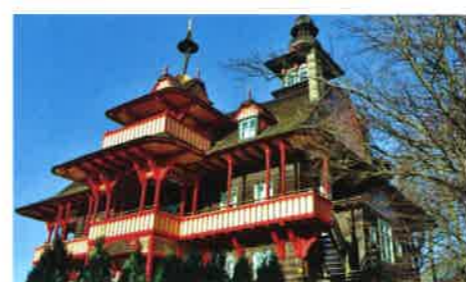
13 Pustevny - Jurkovičovy stavby

Tato mapa vznikla v rámci společné aktivity J18 „Aktivita směřující k propagaci přeshraniční spolupráce a společného území“ projektu Zašová - Korňa přeshraniční spolupráce. Vydala Obec Zašová společně s obcí Korňa. Poskytnutí mapového podkladu – SHOCart, spol. s r.o., Zádveřice 48, 763 12 Zádveřice – Raková. Grafické zpracování a tisk – RAP GROUP s.r.o., Hranická 838, 757 01 Valašské Meziříčí – Krásno nad Bečvou. Náklad 2 000 ks map, rok 2019