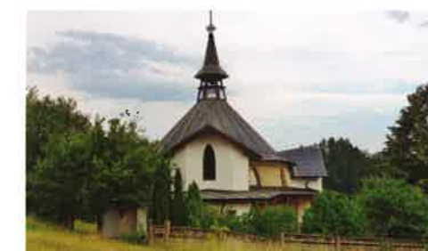
8 Kaple Sv. Ducha Staré Zubří