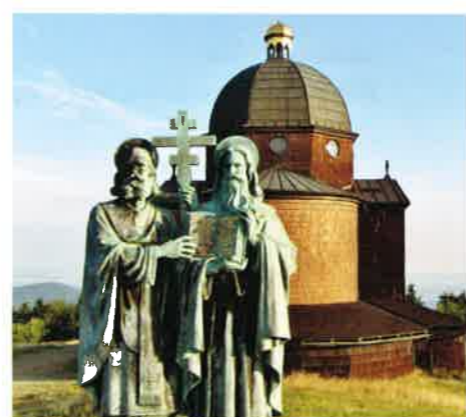
12 Kaple sv. Cyrila a Metoděje na Radhošti