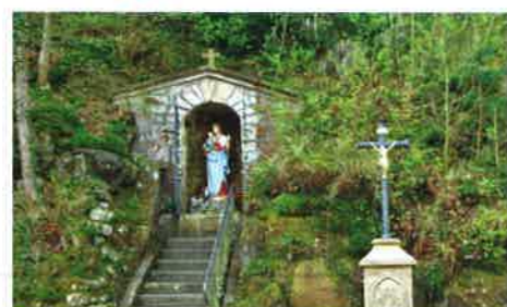
2 Mariánský pramen Stračka