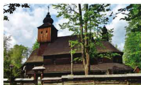
10 Valašské muzeum v přírodě s kostelem sv. Anny