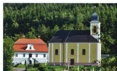
3 Kostel sv. Martina ve Veselé