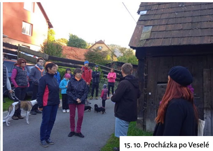
15. 10. Procházka po Veselém