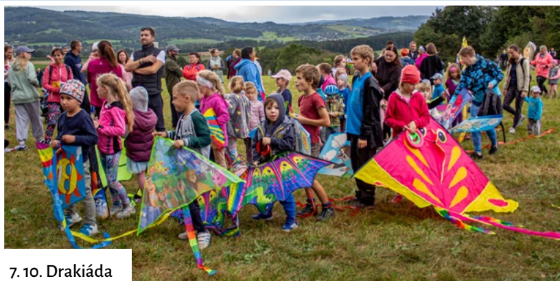
7. 10. Drakiáda