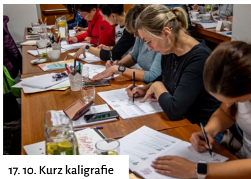
17. 10. Kurz kaligrafie