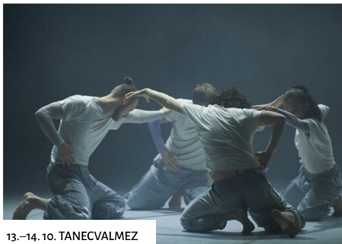
13.–14. 10. TANECVALMEZ