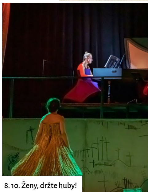
8. 10. Ženy, držte huby!