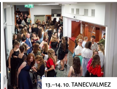
13.–14. 10. TANECVALMEZ