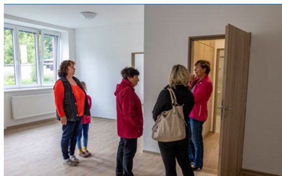
5. 10. Den otevřených dveří v bývalé veselské škole