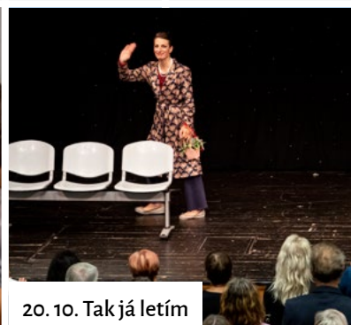
20. 10. Tak já letím