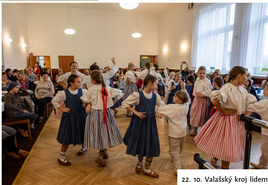
22. 10. Valašský kroj lidem